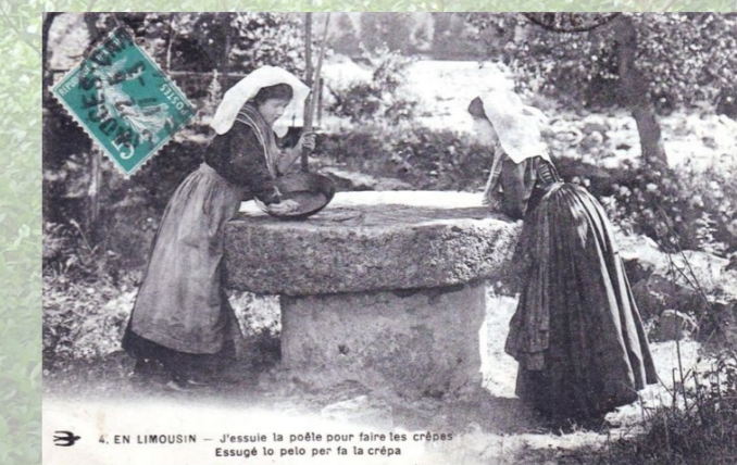
4. EN LIMOUSIN - J'essuie la poêle pour faire les crêpes Essuie lo pelo per fa la crêpa www.dét-empire.net

6/ Muni d'une poêle chaude huilée ou beurrée, lancez-vous dans la cuisson ! 1 min de chaque côté. Bon appétit !